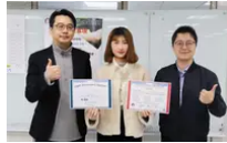
ESG初階管理師99%高通過率再前進！華大...