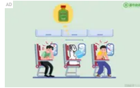
暮帝納斯腹瀉整腸錠