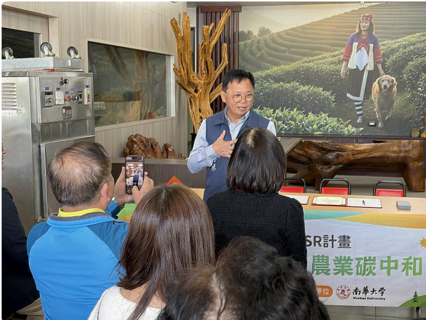
此次合作意向書的簽署，象徵南華大學與地方茶產業攜手邁向永續發展的重要里程碑。未來雙方將持續深化合作關係，透過USR計畫推動永續農業、茶產業創新與農業碳中和發展，為地方產業升級與永續發展注入新的動能，更能提升南華學生的實務經驗與競爭力，共創三贏。