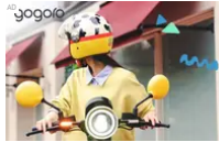
四月超熱門：玩具總動員系列配件新登場！