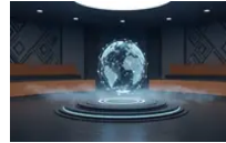
智慧非洲聯盟攜手沃德瓦尼 推動非洲責任...