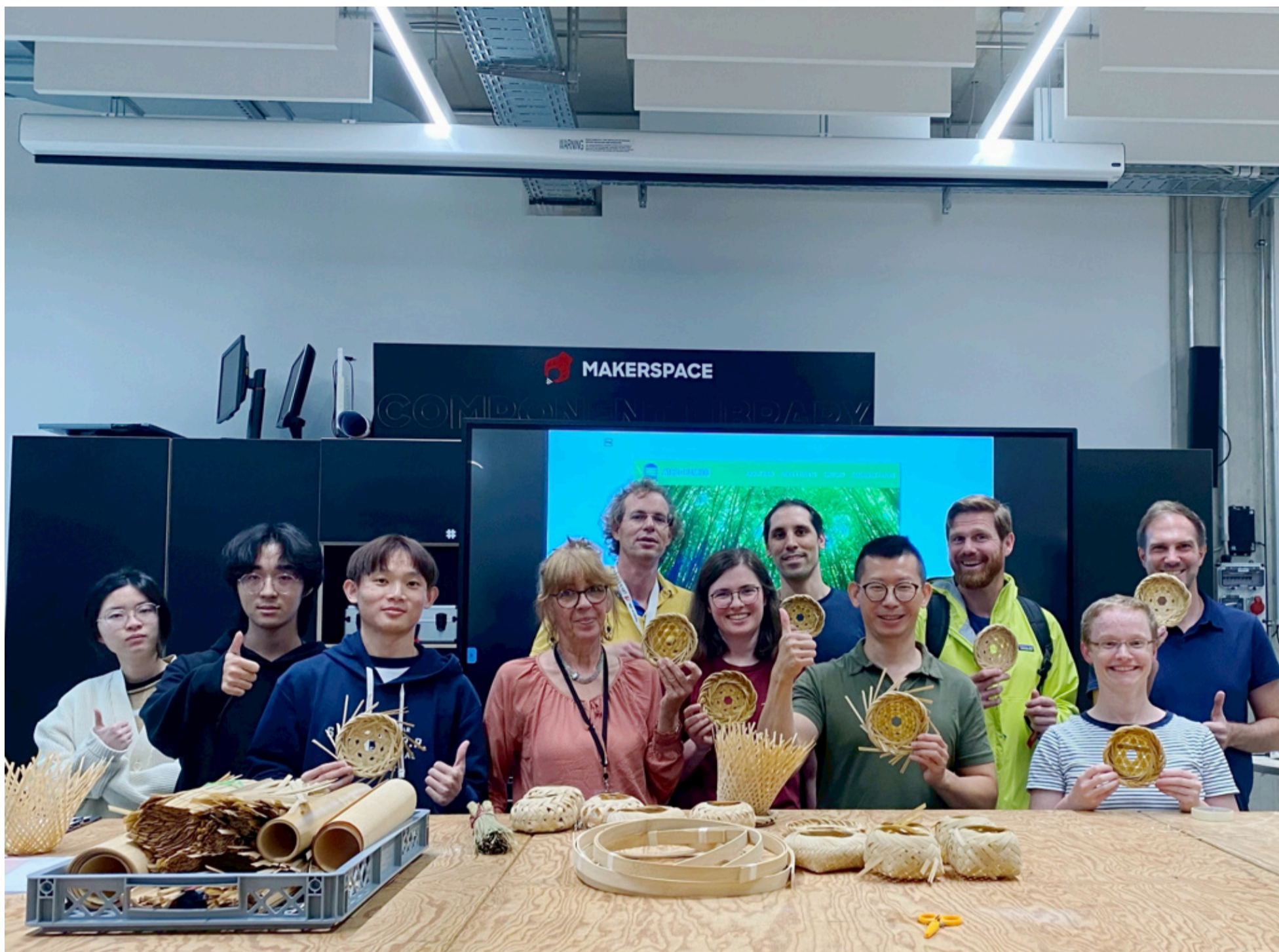
南華大學海外學習資源豐富多元，圖為產設系老師率學生至德國進行海外實習。

南華大學國際企業學士學位學程，外國語文學系、財務金融學系、旅遊學系，社會工作學系、生死學系、建築學系等系所，可參加2+2雙學位、交換生、海外實習、專題發表及海外志工，前往歐洲、英、美、日本、馬來西亞等國家，每年都超過600人次，人人可申請、人人有機會。