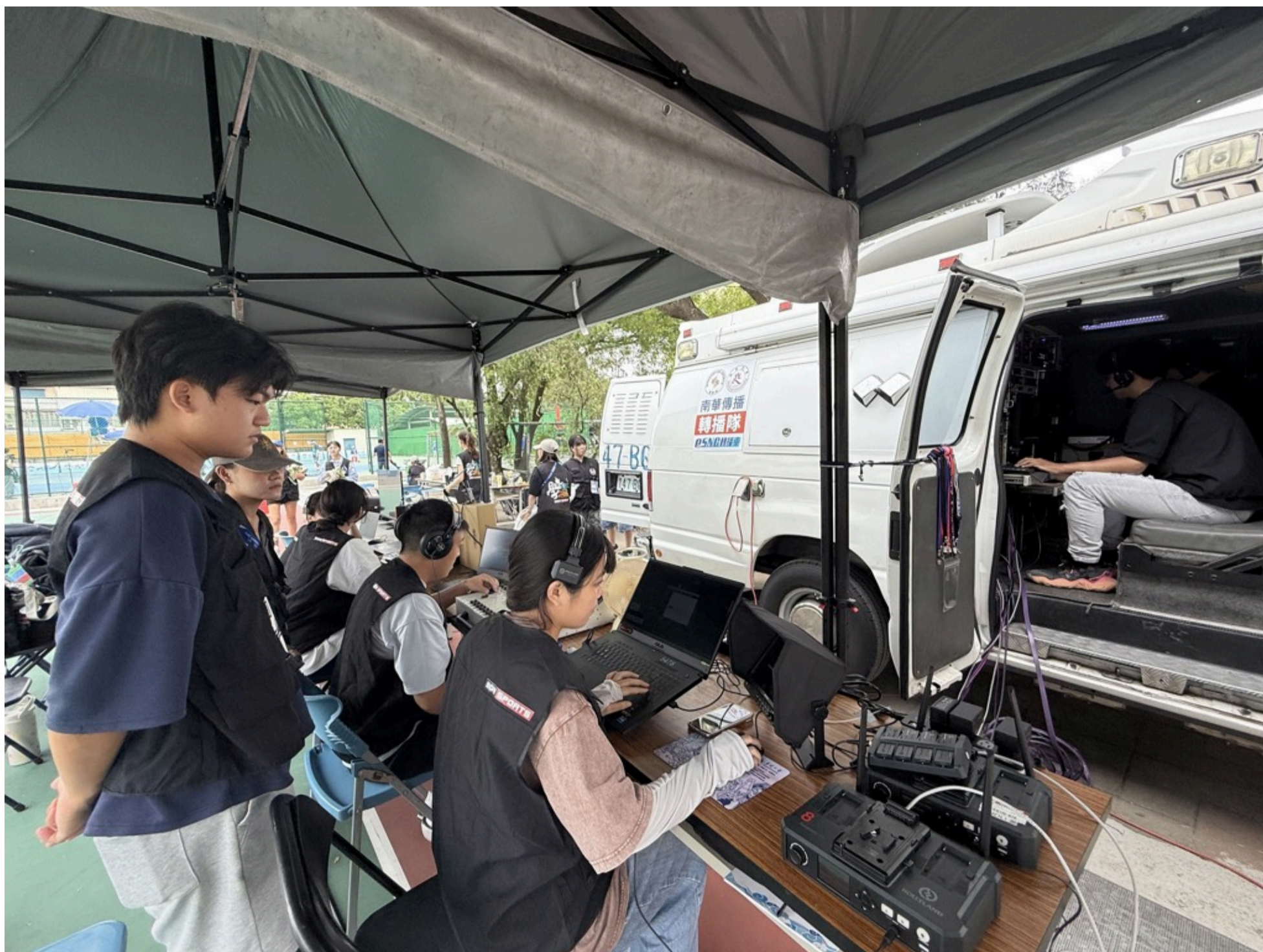
南華大學繁星推薦吸引頂尖學子就讀，圖為傳播系首啟SNG車轉播全國運動會軟式網球。

校長高俊雄表示，因應全球AI浪潮，積極將人工智慧融合於管理、社會科學、設計、及生技等主流學群，除了開設跨領域學程，新增設的半導體應用學士學位學程更深獲考生青睞。其課程規劃涵蓋IC設計、IC製程、半導體封裝測試與材料化學等核心領域，並著重在專題研究與實作課程的投入，未來畢業生除可報考國內外知名研究所深造，亦可投入IC設計工程師、設備工程師等職務，或延伸至光刻機、蝕刻機等半導體相關設備產業，職涯發展前景廣闊。