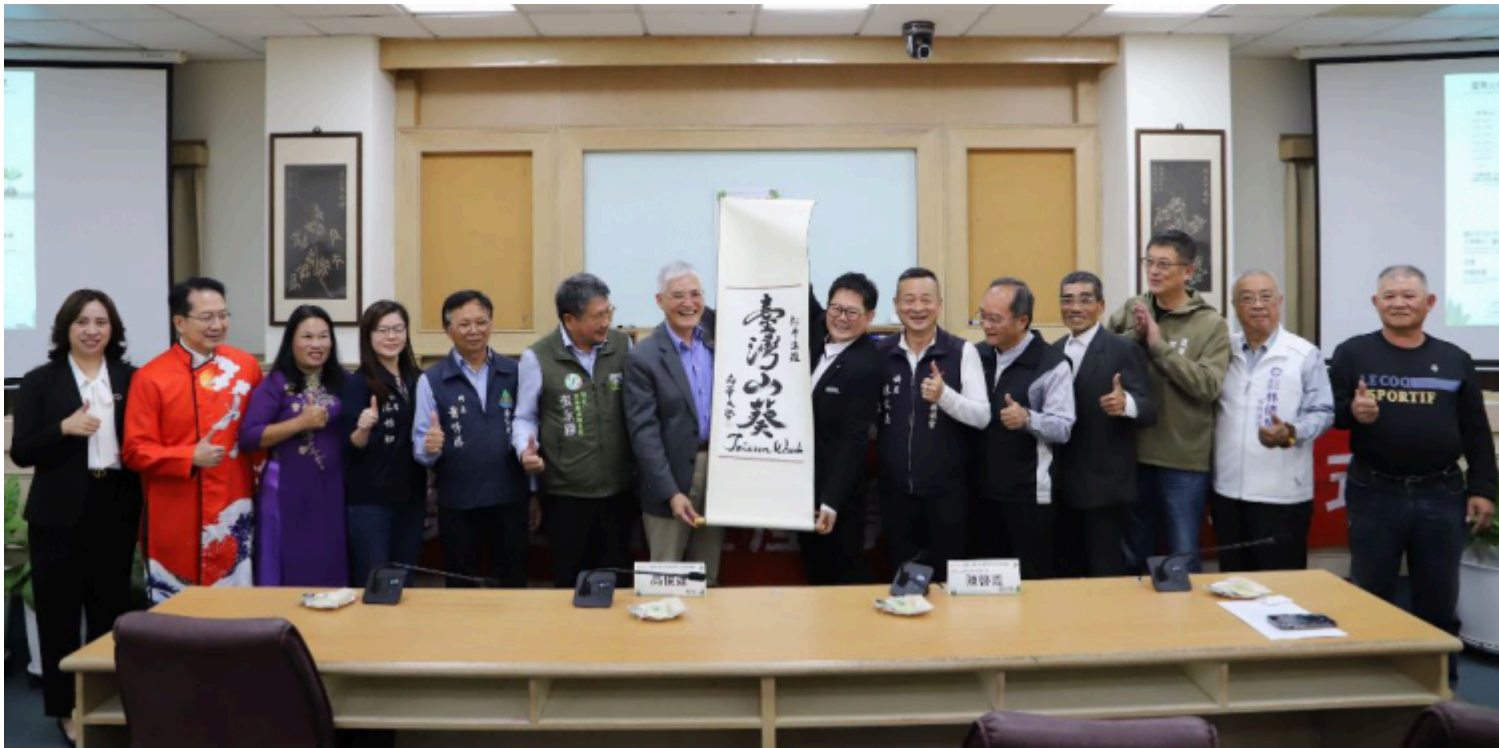
南華大學攜手松井生技深化產學合作，啟動「臺灣山葵」正名，貴賓雲集一同見證重要時刻。

松井生技開發食品有限公司是臺灣市佔率最高的山葵產品公司，目前研發重點主要在利用山葵芽體做為培植體，進行多倍體誘導研究，透過基因組加倍，可強化山葵的植株發育，以得到更高的產量、更粗大的莖部，且能提升風味或有效成分含量，可提高山葵產品在功能性食品、辛香料與保健食品市場的附加價值。為更進一步推動山葵產業鏈向上發展，本次松井生技公司與南華大學簽訂「臺灣山葵微體繁殖研究計畫」，主要係由松井公司提供研究經費，支持南華大學科技學院自然生物科技學系技術團隊進行山葵組織培養與苗種繁殖研究，預期可大幅提升臺灣山葵幼苗量與栽培效率，建立優質種原體系，打造高品質與穩定生產之基礎。未來將由學研端與企業端共同深化品系改良、產品研發及碳足跡計算之研究布局，形塑永續農業與循環食品產業新模式。