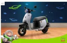
預算 4 萬*內，Gogoro EZZY 500 玩具總動員...