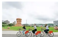
淡水、八里騎YouBike就能抽獎！新北限定活...