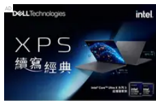
為什麼有些人一打開筆電，就看起來很專業？