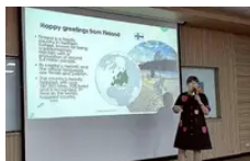
南華大學邀請芬蘭幼教權威分享 從遊戲與藝...