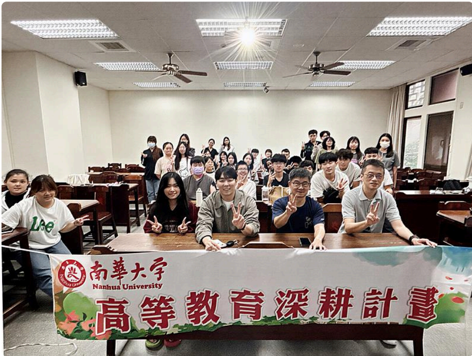
此次貼紮實作課程不僅展現南華大學在健康促進與教學創新上的具體成果，也回應當前社會對於運動安全與自我照護能力的重視。未來學校將持續規劃多元實務課程，深化健康素養教育，培養具備專業知能與生活應用能力的人才，逐步建構更完善的健康校園環境。