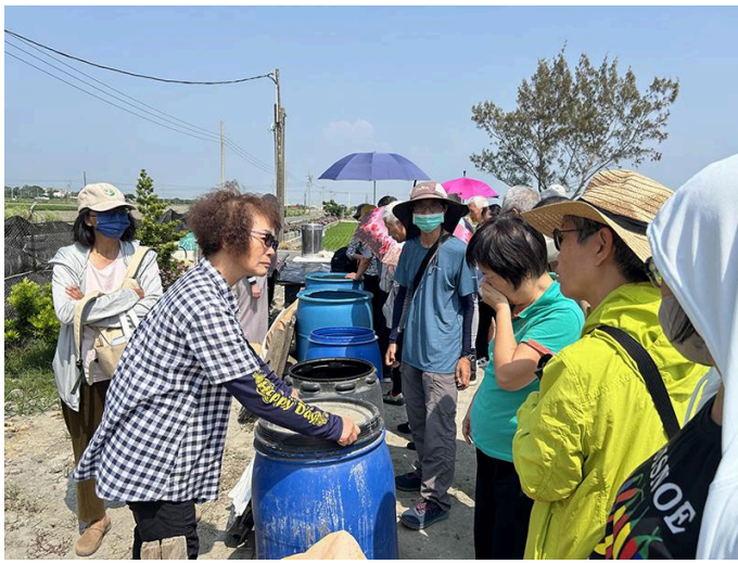
圖02.南華大學科技學院舉辦KKF自然農法推廣活動，進行菌水與液肥製作教學，說明原理與操作要點，提升民眾對永續農法的理解。

本次活動核心技术之一為「KKF自然農法」，其特色在於運用「微生物菌水」進行農業管理。該技術以森林腐植土中的原生微生物為基礎，透過糖蜜、米糠與水進行培養，使多樣性微生物大量繁殖，形成具有分解有機質、抑制惡臭及促進作物生長的菌相系統。