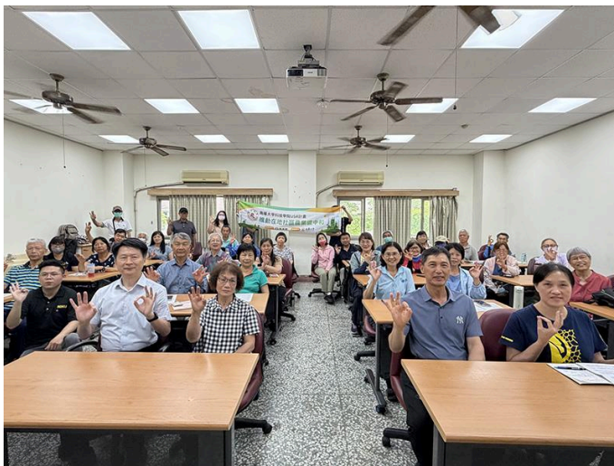
圖01.南華大學科技學院舉辦「零廢棄、零碳排：KKF自然農法引領的循環農業之路」專題講座，與會人員大合照。

為推動永續農業與淨零排放理念，南華大學科技學院於4月20日舉辦「零廢棄、零碳排：KKF自然農法引領的循環農業之路」推廣活動，透過專題講座、實作體驗與場域參訪，帶領學員深入了解循環農業與減碳農法的實踐方式，展現大學社會責任（USR）在地方永續發展中的具體成果。