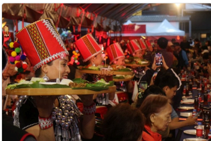
2026桃園龍岡米干節 哈尼族傳統長街宴 4/24正式開賣 2026-04-23