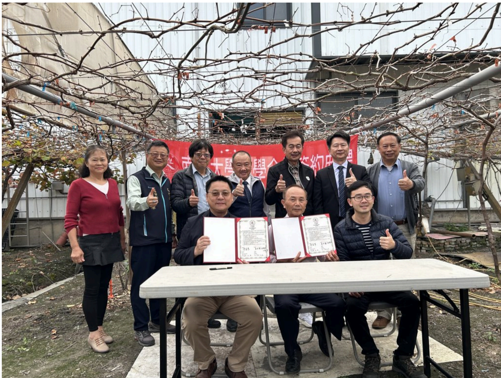
南華大學與美香農場簽署合作，攜手推動永續農業。產官學各方代表也一同出席見證。

本次合作由南華大學科技學院與美香農場共同推動，並邀請農業部臺中區農業改良場擔任官方輔導角色，形成完整的產官學合作架構，當天產官學各方代表也出席見證簽約儀式，展現跨域攜手推動永續農業的決心。