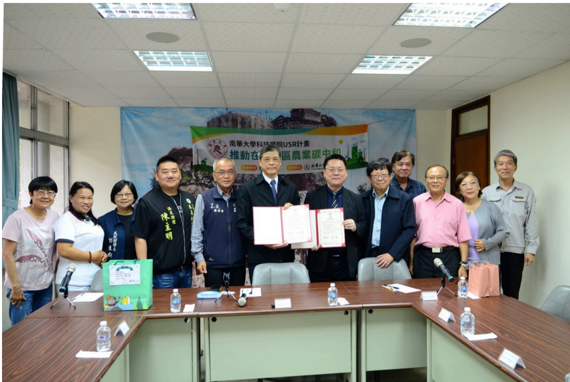
南華大學科技學院與欣欣水泥企業股份有限公司完成合作意向書簽署，與會貴賓合影留念。

南華大學科技學院於4月1日與欣欣水泥企業股份有限公司舉行合作協議書簽約儀式，雙方正式建立產學合作關係，未來將共同推動永續發展、環境教育及USR計畫實踐，並協助欣欣水泥申請環境教育設施場所認證，透過產官學合作模式，提升企業ESG發展與環境教育品質。