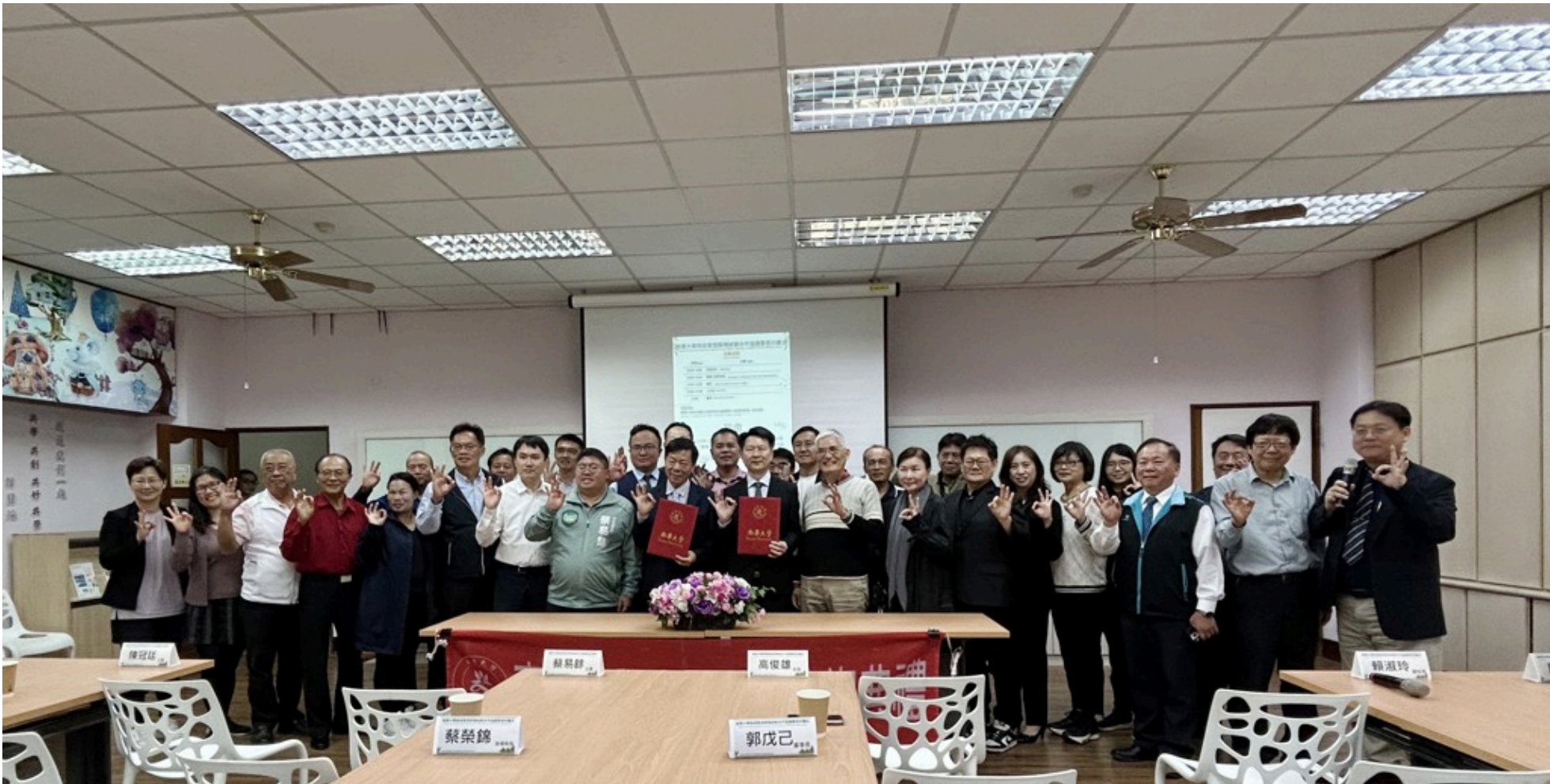
南華大學與袋寶塑膠機械廠簽署產學合作協議，與會貴賓合影。

未來，南華大學與袋寶塑膠機械廠將持續深化合作內容，透過產學交流、研究合作與實作驗證，共同為循環經濟與永續農業發展探索可行路徑，展現大學在回應社會需求與推動永續轉型上的關鍵角色。