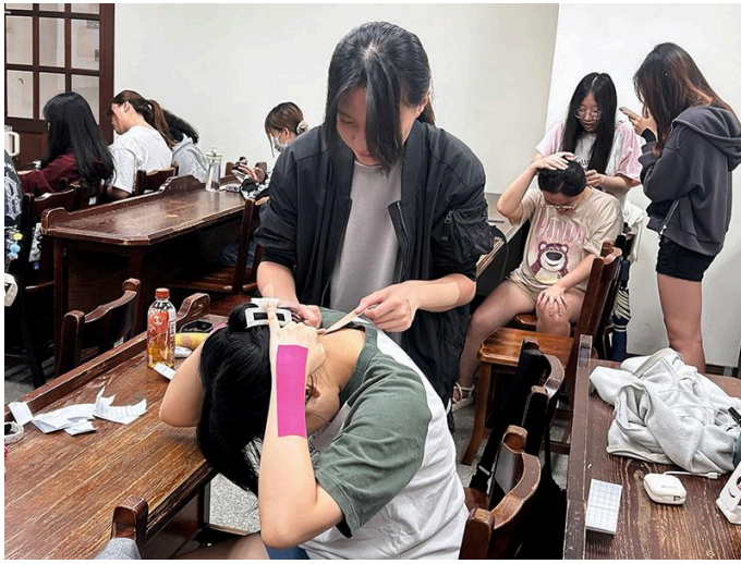
圖04.南華大學舉辦貼紮實作課程，學生互相進行肩頸酸痛貼紮實作練習。

南華大學校長高俊雄指出，身心靈健康是校務發展主軸，2025年獲得世界大學運動總會(FISO)認證健康校園。學校持續推動跨領域整合與實作導向教學，讓學習從理論延伸至實際應用。透過此類課程的規劃，不僅培養師生專業技能，也有助於提升整體健康意識，打造安全且友善的校園環境。