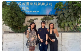
菲籍女遊客遺失手機 新興女警尋回獲讚「Number One」 2026-04-17