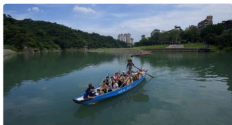
新北微笑山線「和美山碧潭擺波賞春趣」浪漫登場 打造水陸綠色生態旅遊體驗 2026-04-17