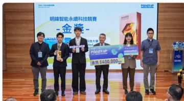
臺科大團隊開發智慧醫療照護能量站 奪明緯智能永續科技競賽金獎 2026-06-22