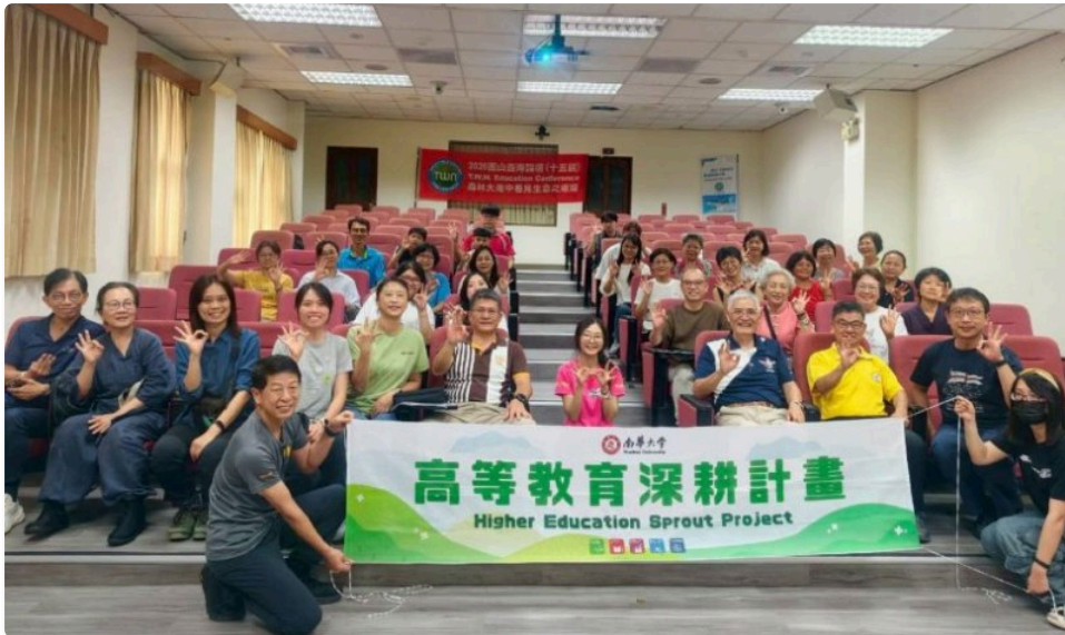
▲南華大學舉辦「2026戶外探索與森林慢活體驗 in 南華」，參與人員合影留念。jpg