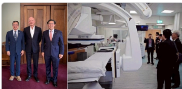
高醫大出訪英國牛津大學 深化醫學教育、AI精準醫療與雙邊合作 2026-06-22