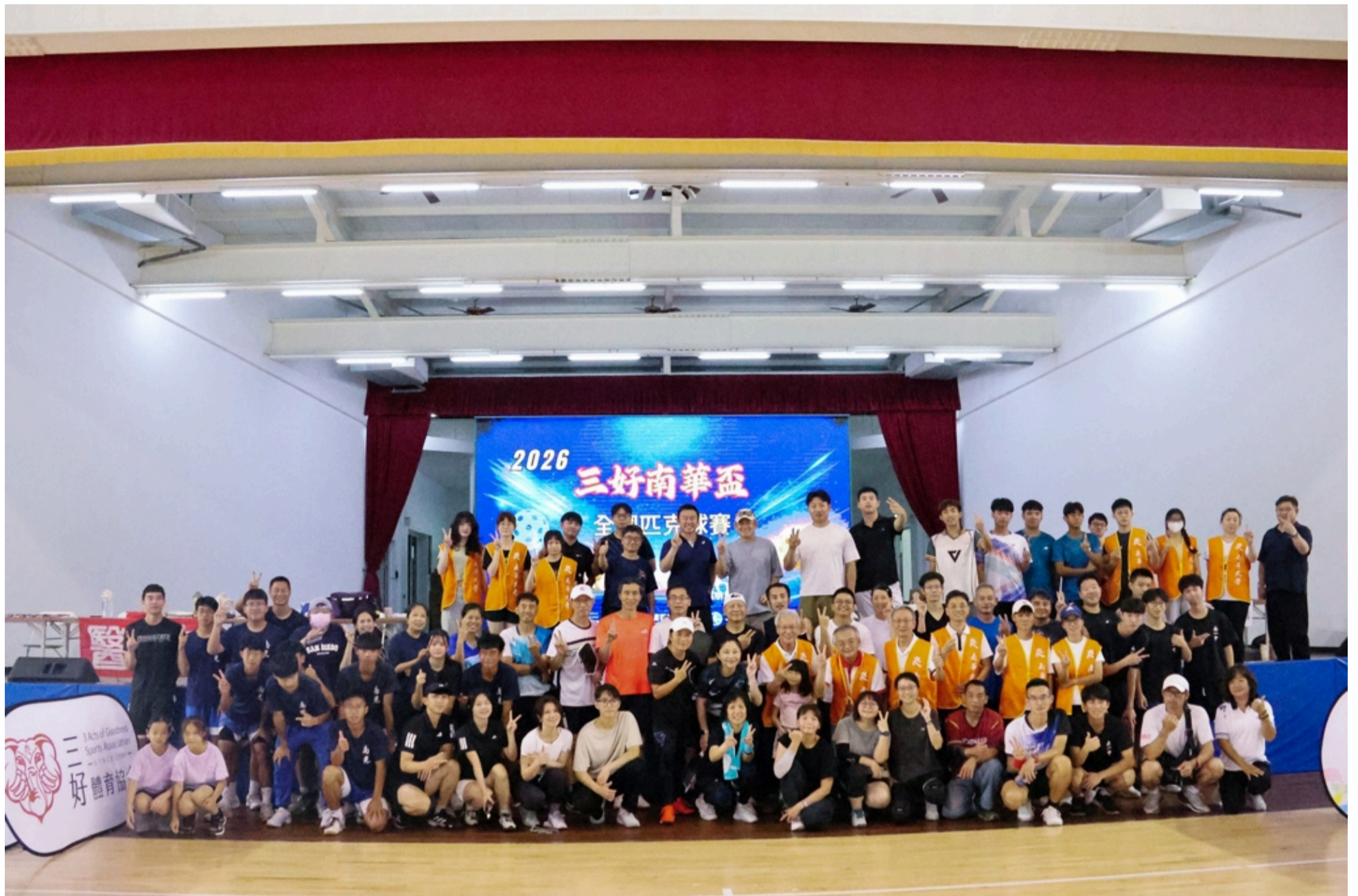
南華大學舉辦「三好南華盃全國匹克球賽」，參與人員大合照。

南華大學於日前舉辦「三好南華盃全國匹克球賽」，吸引來自全國69組隊伍、逾200名選手齊聚競技，場面熱烈。此賽事不僅是匹克球界的年度盛事，更充分展現南華大學長期落實「三好精神」及厚實的運動發展實力。