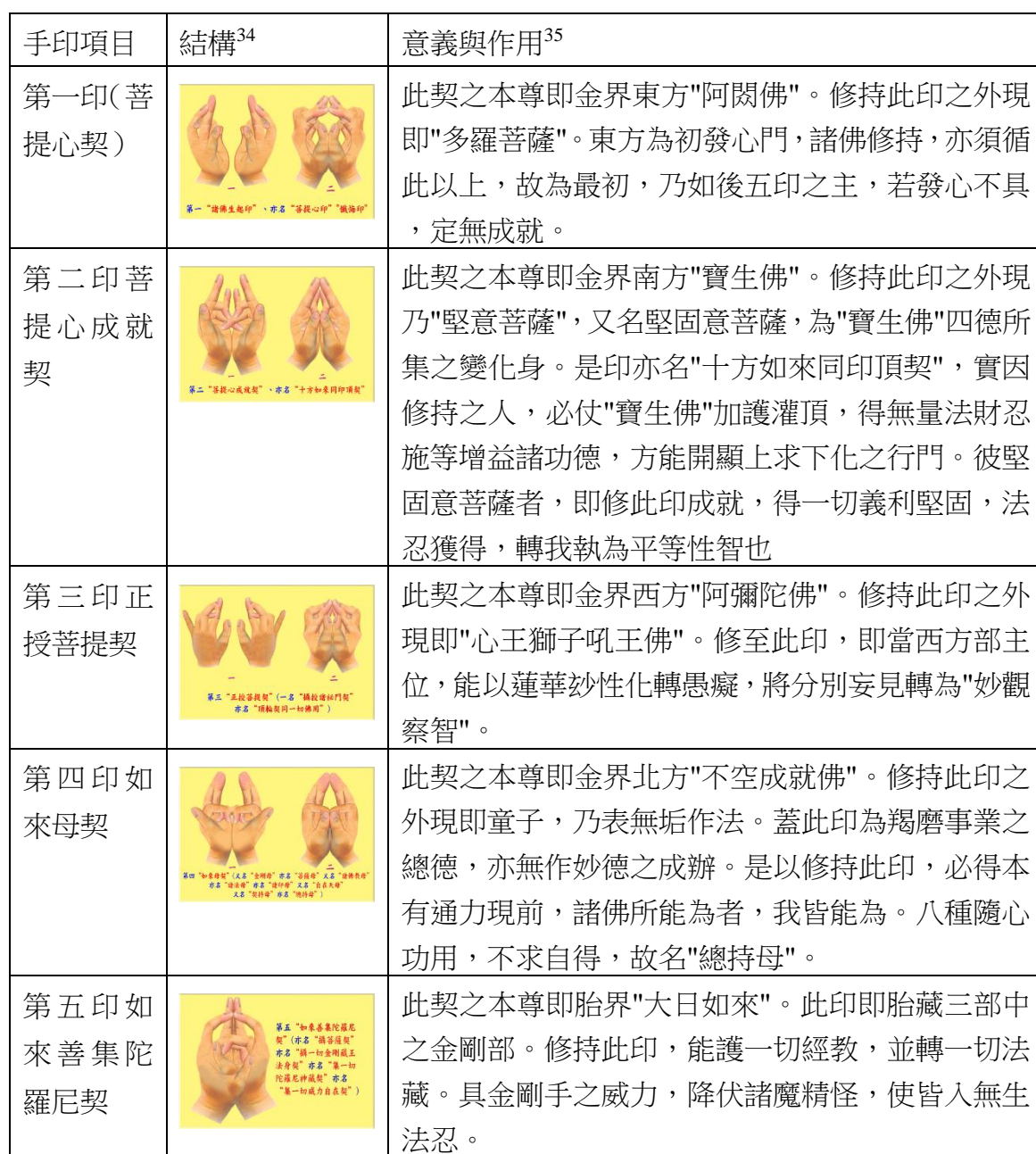
表 2 六印說明