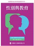
性別與教育：女性主義社會學的想像

本書分類： 社會科學 > 教育 > 教育史/教育研究 本書分類： 專業/教科書/政府出版品 > 社會與心理類 > 社會與社工 > 社會學