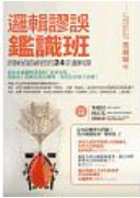
邏輯謬誤鑑識班：訓練值錯神經的24堂邏輯謬誤