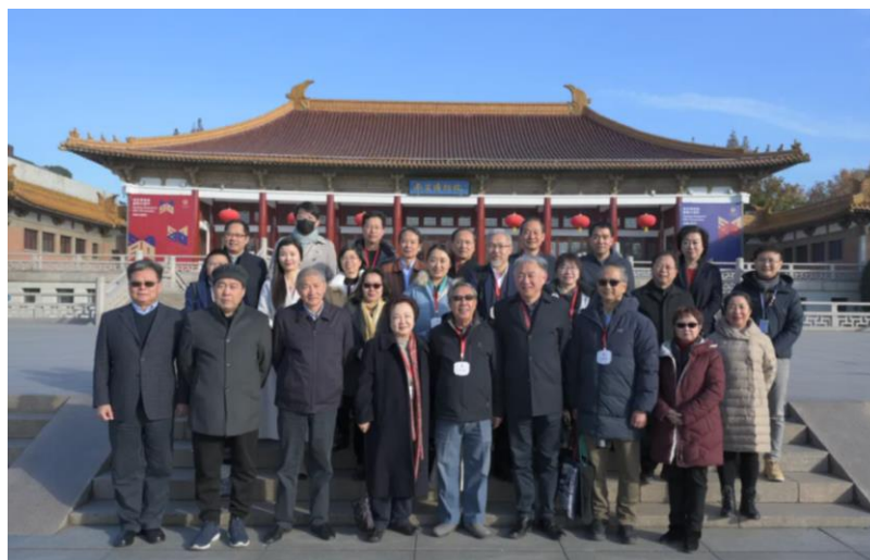
玉潤中華-玉文化與中華文明學術研討會 與會代表南京博物院廣場合影

为更好的阐述中华传统玉文化，立足当下、着眼未来，并将玉文化研究引向深入，2023年12月2日~3日，南京博物院举办“玉润中华——玉文化与中华文明”学术研讨会。希望通过交流、研讨，进一步解读中华玉文化与中华文明发展的关系，揭示中华玉文化所蕴涵的中华文明连续性、创新性、统一性、包容性、和平性五个突出特性；并着眼讨论当下新时代的中华玉文化发展与繁荣问题。